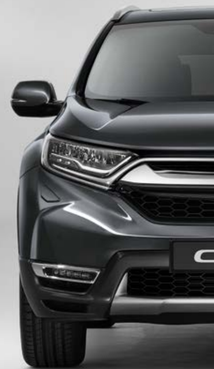
METALICKÁ MODERN STEEL