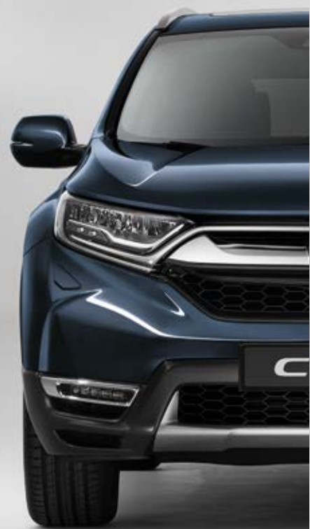
METALICKÁ COSMIC BLUE