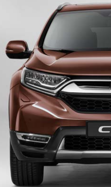
PERLEŤOVÁ PREMIUM AGATE BROWN