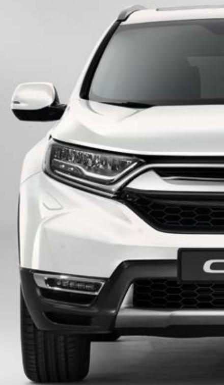
PERLEŤOVÁ PLATINUM WHITE