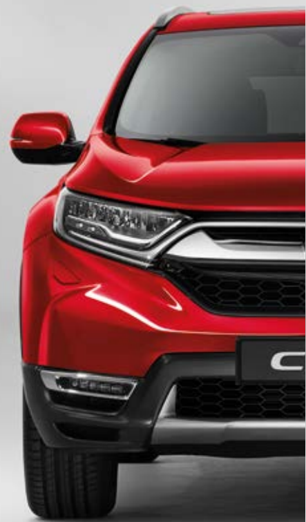
METALICKÁ PREMIUM CRYSTAL RED*

Každá barva byla vytvořena, aby dokonale doplňovala styl vozu CR-V. Vám stačí vybrat si podle svých představ.