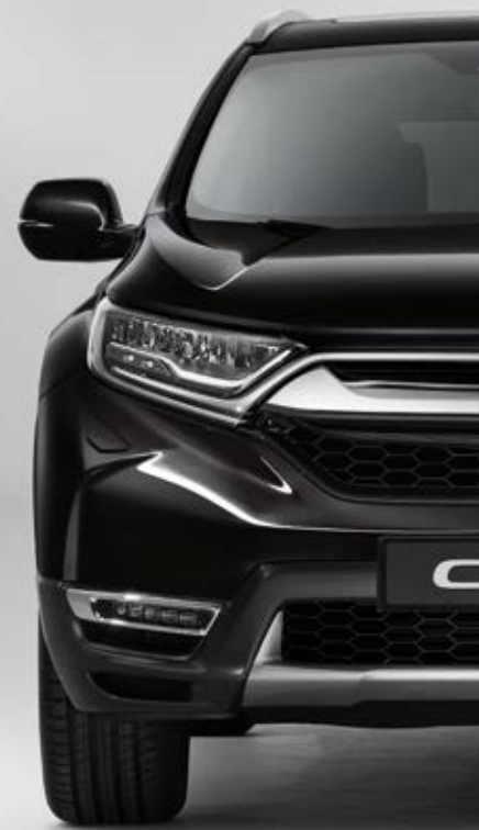
PERLEŤOVÁ CRYSTAL BLACK