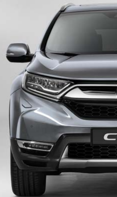
METALICKÁ LUNAR SILVER